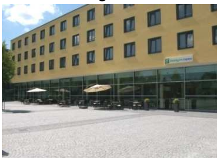
Das "Holiday Inn Express"

Kulinarische Vielfalt hingegen kann man in der Marktpassage entdecken. Nebenbei findet man dort im 1.OG (zu erreichen durch einen Aufzug) die Stadtbibliothek und das Bürger- und Tourismuszentrum. Wenn wir in der August-Ruf-Straße die ersten Einkaufstaschen gefüllt haben