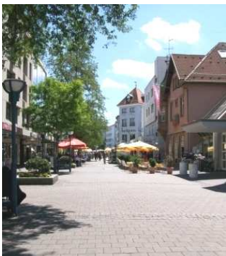
Blick in die August-Ruf-Straße

Wir starten unsere Shopping-Tour im Herzen der Stadt Singen am Hauptbahnhof. Der Hauptbahnhof Singen ist gut zu erreichen und barrierefrei. Vom Bahnhof aus ist man direkt in der Fußgängerzone (August-Ruf-Straße), die viele Einkaufsmöglichkeiten wie auch Sitzmöglichkeiten bietet. Modegeschäfte, wie „Heikorn“ und „Zinser“ bieten eine Vielfalt an modischen Trends.