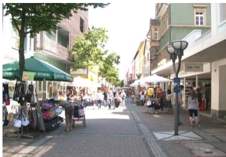
Blick in die Scheffelstraße

unsere Shopping-Tour fort. Wir gehen am Hohgarten entlang und biegen in die Scheffelstraße ein. Etwas müde von der langen Shopping-Tour machen wir uns auf den Weg zurück zum Bahnhof.